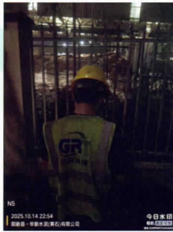
厂界东南侧外▲5 (夜间)