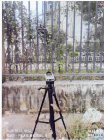
厂界西南侧外 2#▲4 (昼间)