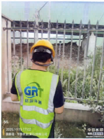
厂界东南侧外▲5 (昼间)